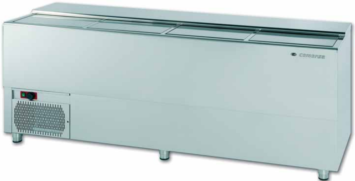
GREDOS T.I. 2000