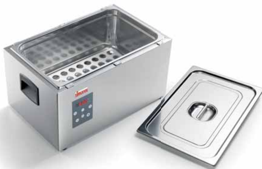
SOFTCOOKER S 1/1 GN 1.coperchio standard standard lid