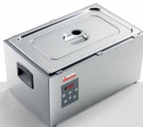
SOFTCOOKER S 1/1 GN