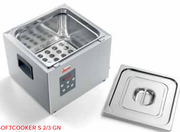
SOFTCOOKER S 2/3 GN 2.coperchio standard standard lid