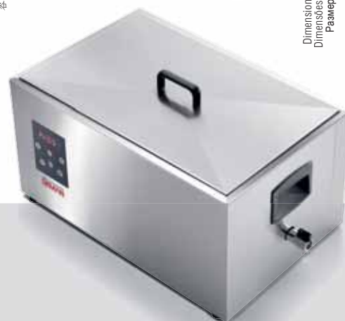
SOFTCOOKER SR 2/3 GN