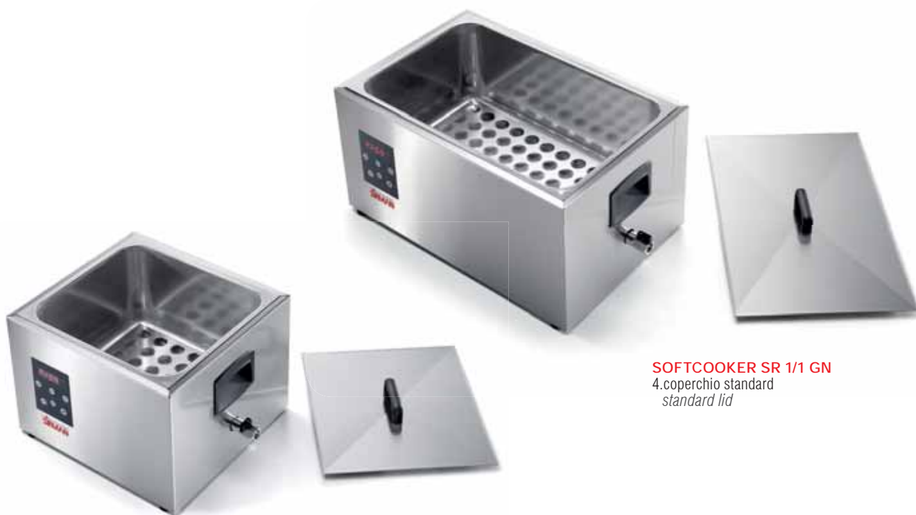
SOFTCOOKER SR 1/1 GN 4.coperchio standard standard lid