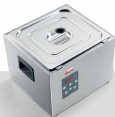
SOFTCOOKER S 2/3 GN